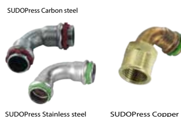
SUDOPress Carbon steel